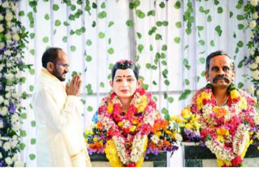
పూతలపట్టు స్వర్ణ సాగరం జూన్ 01

తల్లిదండ్రుల జ్ఞాపకార్థం విగ్రహాలు ప్రతిష్ఠించిన కుమారుడు.. వర్ధంతి సందర్భంగా ఘన నివాళులు..