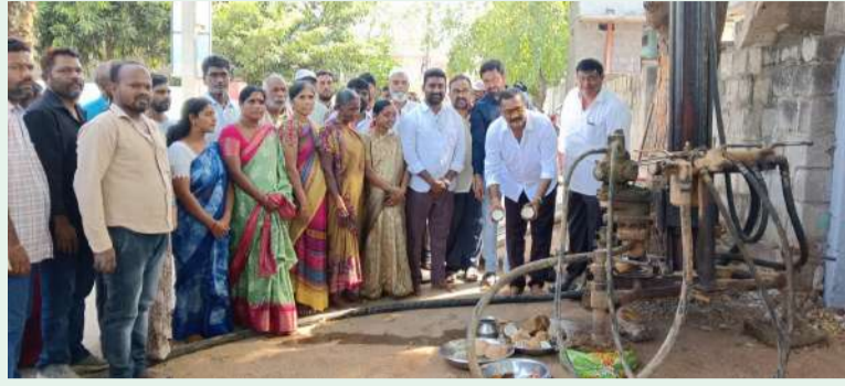
స్వర్ణసాగరం, హుజూర్ నగర్ జూన్ / 01