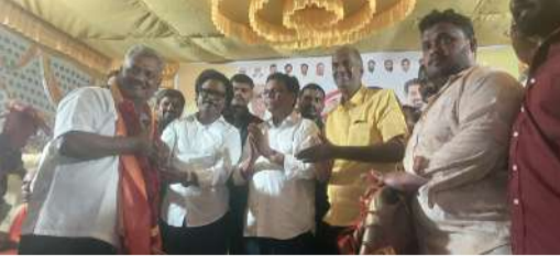
శ్రీరంగరాజుపూర్ : స్వర్ణ సాగరం: మే 31: