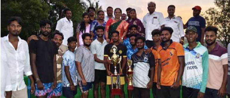
శ్రీరంగరాజపురం, స్వర్ణ సాగరం: మే 31: