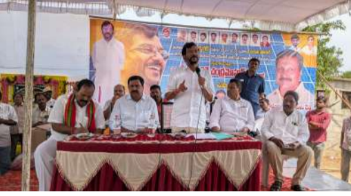
తోటపల్లి గూడూరు స్వర్ణసాగరం జూన్ 1

“కాకాణి కంటికి” “కనిపించని” అభివృద్ధి బహిరంగ చర్యకు “వెనకడుగు” వలిగింపడం పర్యటనలో ఎమ్మెల్యే సోమిరెడ్డి “విసుర్లు”