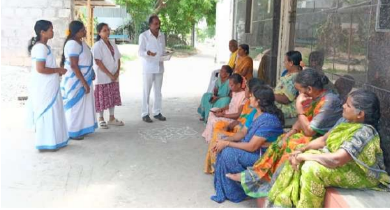
పూతలపట్టణ స్వర్ణసాగరం జూన్ 1